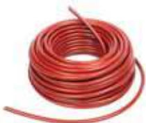
cable haute tension 25 m réf. 28695

Pour le raccordement, il faudra procéder de la même manière que pour l'étape 2.