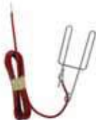
épinglette de connexion réf. 28697

Dévissez la borne rouge du POWERMAX 1000 sans forcer, puis y insérer une épinglette de connexion côté dénudé (réf : 28697). Resserrez la borne afin de bloquer le câble et accrochez l'épinglette sur votre fil ou votre ruban.