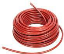
câble haute tension 25 m réf. 28695

Pour le raccordement, il faudra procéder de la même manière que pour l'étape 2.